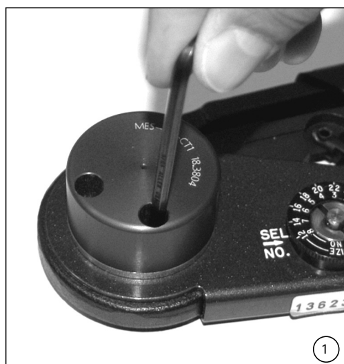
(ill. 1) Fixer le locator à l'aide de la clé à 6 pans fournie.