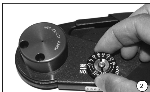
(ill. 2) Régler le sélecteur.